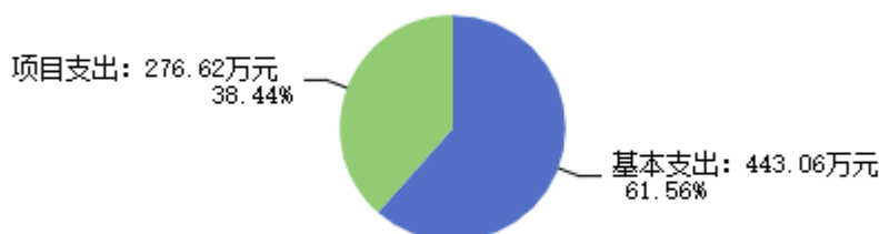
图2：支出决算结构图

2024年度支出合计719.68万元，其中：基本支出443.06万元，占61.56%；项目支出276.62万元，占38.44%。