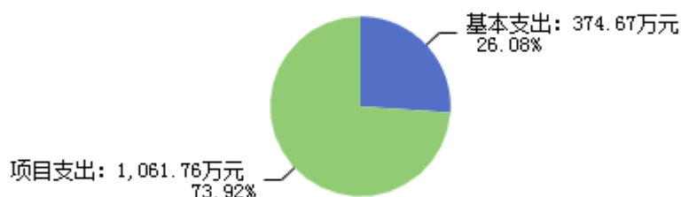
图2：支出决算结构图

2024年度支出合计1,436.43万元，其中：基本支出374.67万元，占26.08%；项目支出1,061.76万元，占73.92%。