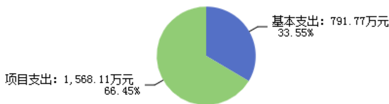
图2：支出决算结构图

2024年度支出合计2,359.88万元，其中：基本支出791.77万元，占33.55%；项目支出1,568.11万元，占66.45%。