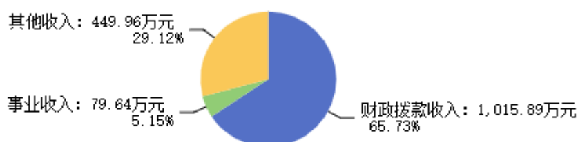
图1：收入决算结构图

2024年度收入合计1,545.49万元，其中：财政拨款收入1,015.89万元，占65.73%；事业收入79.64万元，占5.15%；其他收入449.96万元，占29.12%。