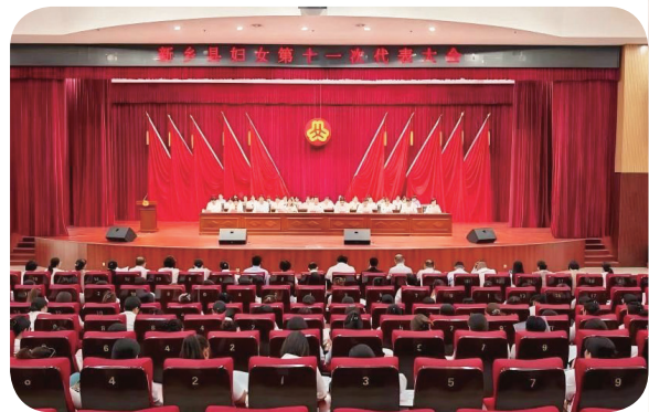
7月15日，新乡县妇女第十一次代表大会召开