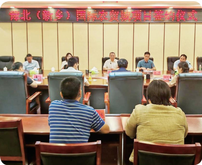
7月31日，豫北（新乡）国际农贸城项目签约仪式举行