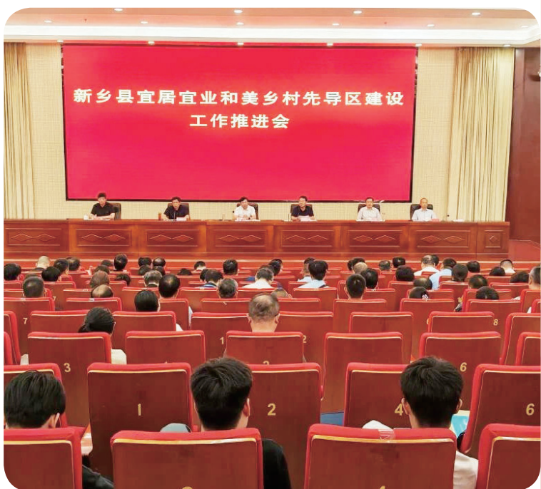
8月2日，新乡县宜居宜业和美乡村先导区建设工作推进会召开