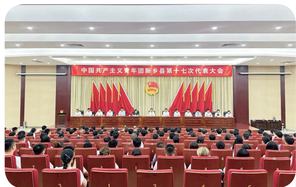
7月16日，中国共产主义青年团新乡县第十七次代表大会召开