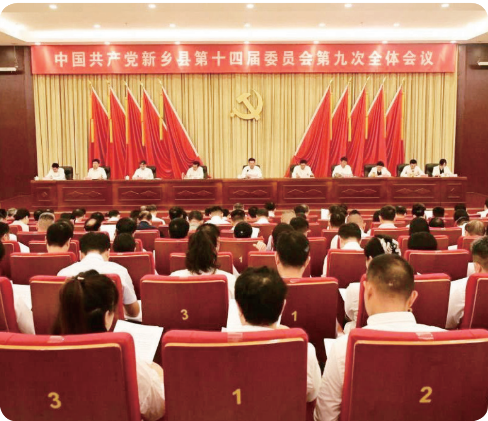
7月22日，中国共产党新乡县第十四届委员会第九次全体会议召开